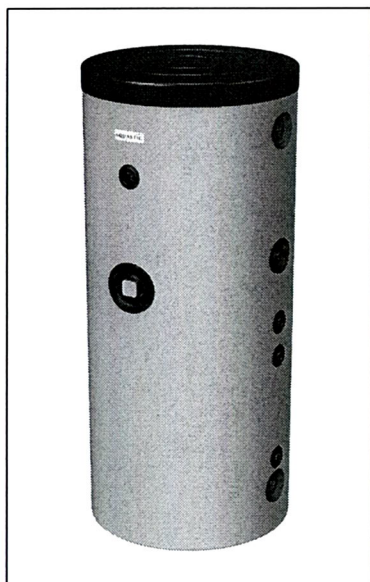
AQ STA ...C

A nyilatkozat tárgya / object of the declaration / Gegenstand der Erklärung / Objet de la déclaration / Предмет декларации / Předmět prohlášení / Obiectul declarației: