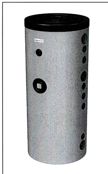
AQ STA ...C2